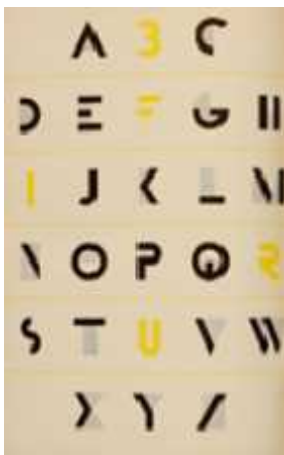
Page extraite du livre de Paul McNeil Histoire visuelle de l'art typographique. Voir page 5